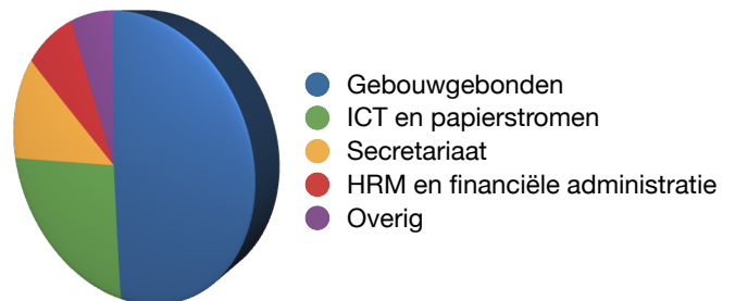
Figuur: Relatieve verdeling van de kosten van de ondersteuning

Met de analyses kunt u uw plannen maken, uw plannen toetsen en/of uw plannen onderbouwen. De analyses resulteren in verschillende scenario's. Zo heeft u de mogelijke keuzes voor het inrichten van Het Nieuwe Werken en Het Nieuwe Kantoor en hun consequenties snel inzichtelijk.